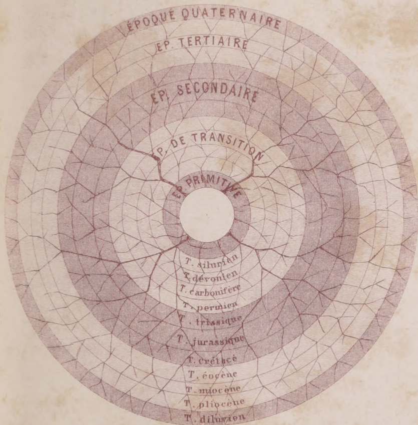
TABLEAU SYNOPTIQUE de la TRANSFORMATION DES ESPÈCES . par P. TRÉMAUX