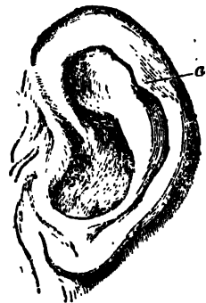
২নং ছবি—মানুষের কান ছাঁচ এবং অক্ষণ-মিঃ উলনারের! a.—প্রকৃষ্ট বা উৎকৃষ্ট বিন্দু