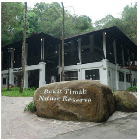
Con rắn mù (còn gọi là rắn giun) được tìm thấy trên lối đi bộ tại khu bảo tồn Bukit Timah.

Rắn giun thường dành cả cuộc đời sống dưới lòng đất. Năm 2015, một cuộc khảo sát được tiến hành nhưng người ta không tìm thấy rắn giun, sở hữu chiều dài khoảng 52 cm.