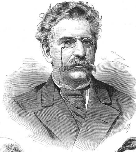
J. M. D'ANDRADE CORVO.